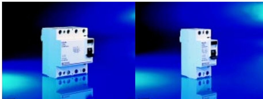
Foto 4. Interruttori magnetotermici differenziali modulari serie FCO