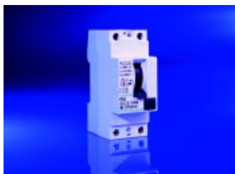
Foto 3. Interruttori differenziali modulari serie NFI