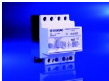
Foto 2. Interruttori differenziali modulari serie FIE